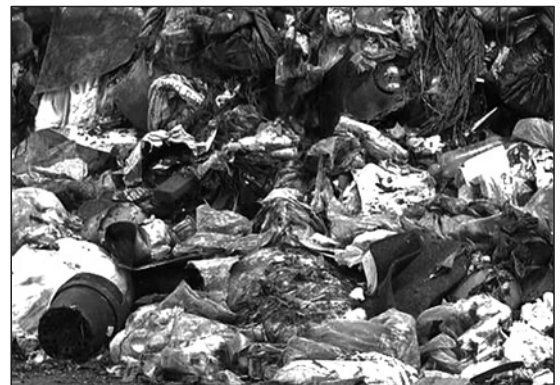
Was geschieht mit unserem Müll?