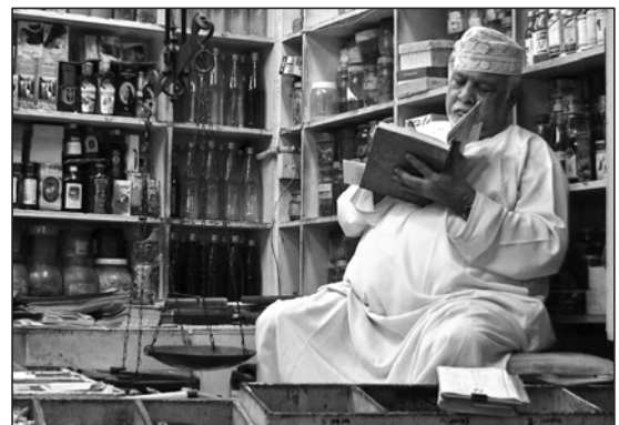
Oman: Basare gehören zum Wirtschaftsleben