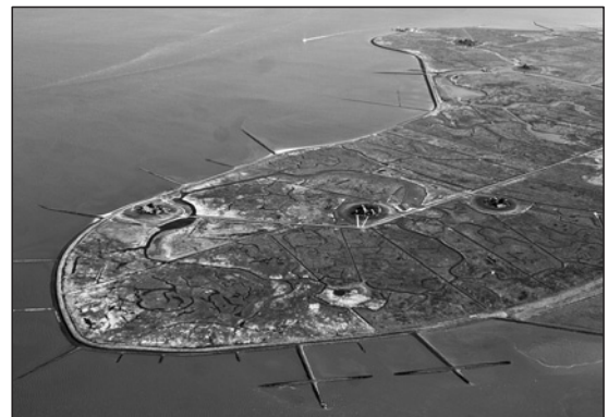
Einzigartige deutsche Landschaft: die Halligen